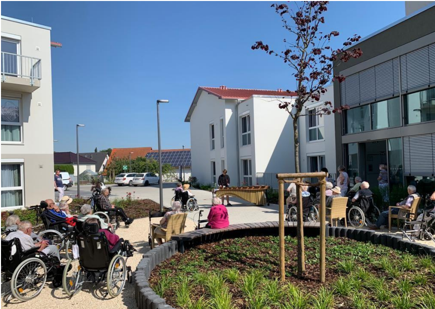
Freiluftkonzert im Johanniter-Seniorenzentrum bei herrlichstem Wetter.

Das große Marimbaphon, das mit vielen weiteren Orff-Instrumenten über das LEADER-Projekt angeschafft werden konnte, kam im Jahr 2020 trotz Corona-Krise bereits zweimal zum Einsatz.